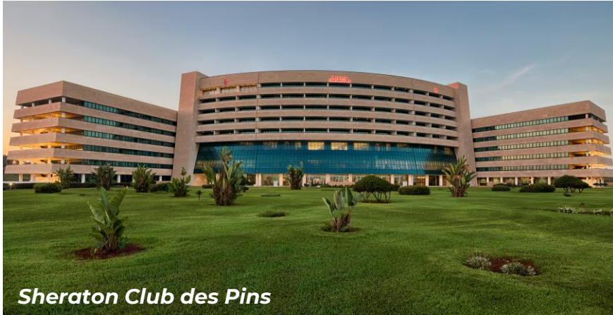
Sheraton Club des Pins