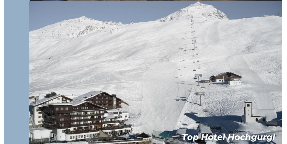
Top Hotel Hochgurgl