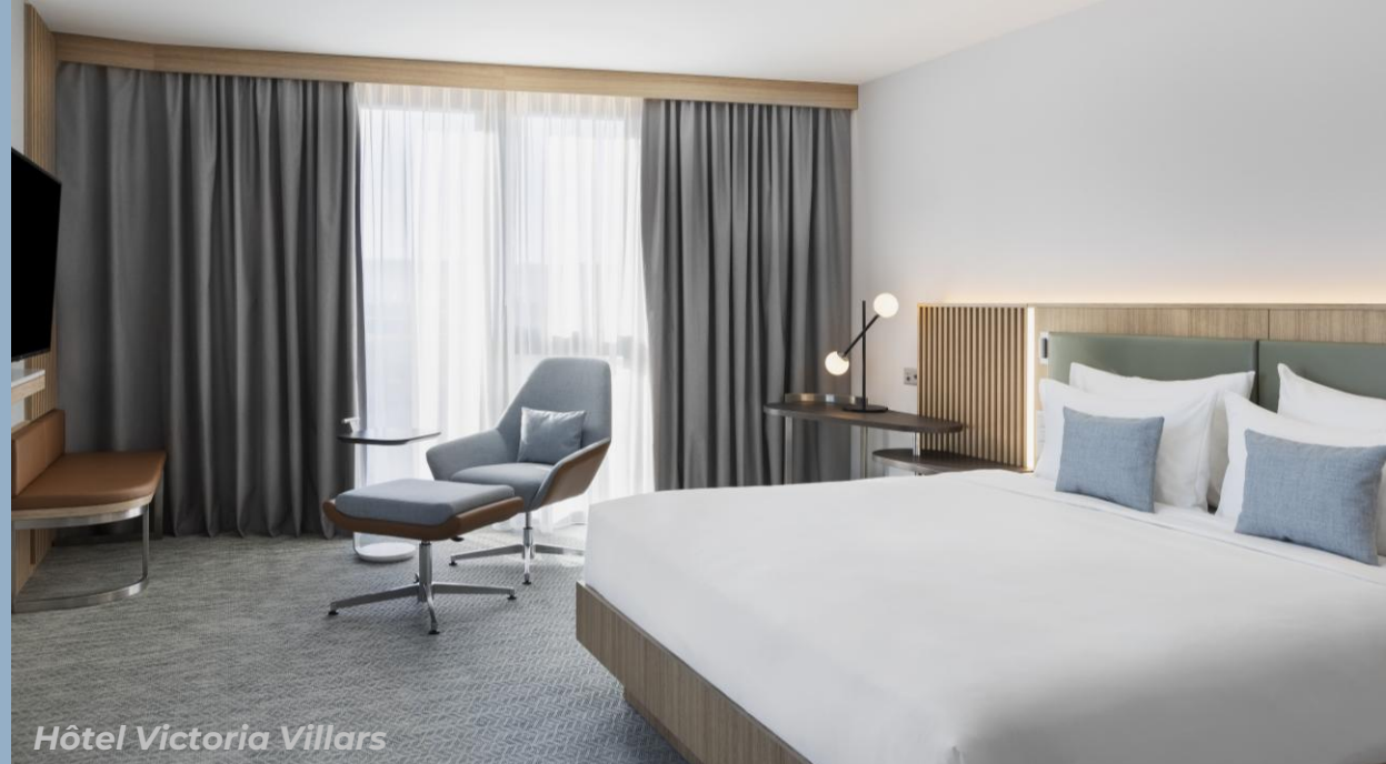
Hôtel Victoria Villars