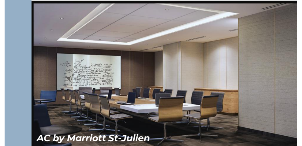
AC by Marriott St-Julien