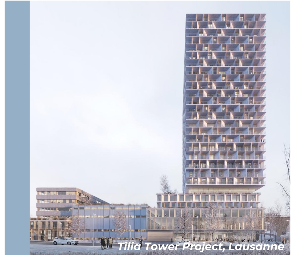
Tilia Tower Project, Lausanne